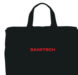
Sac de transport