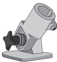
Unidad de articulación de Trípode